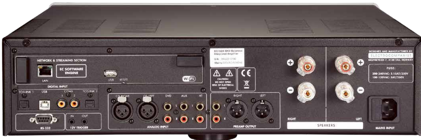
Kontaktfreudig: Der ECI 6 DX MKII bietet Vor-/Endverstärker, DAC und Streamer in einem und lässt sich unsymmetrisch wie symmetrisch verkabeln.

Der Netzwerk-Player ist praktisch neu und auf den aktuellen Stand gebracht. Im